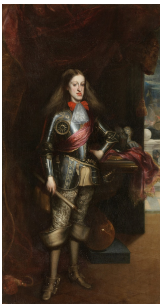
Juan Carreño de Miranda. Carlos II con su armadura , 1681, óleo sobre lienzo 232 x 1.25 cm, Madrid, Museo del Prado, Colección Real, nº de catálogo P07101.