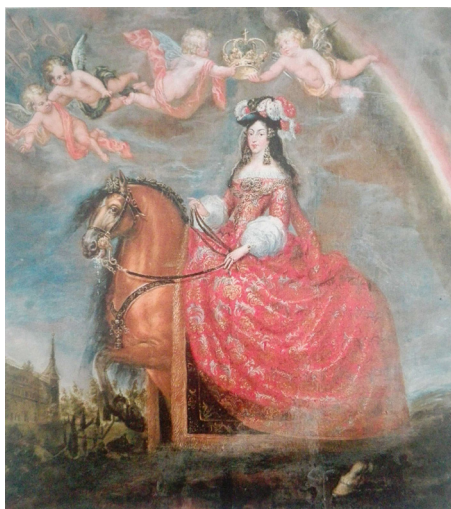
Francisco Rizi. María Luisa de Orleans a caballo , 1680, óleo sobre lienzo 344 x 312,5 cm, Toledo, Ayuntamiento de Toledo.