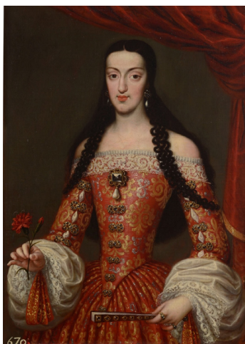
José García Hidalgo. María Luisa de Orleans , 1680, óleo sobre lienzo 96 x 68 cm, Madrid, Museo del Prado, Colección Real, nº de catálogo P00652.