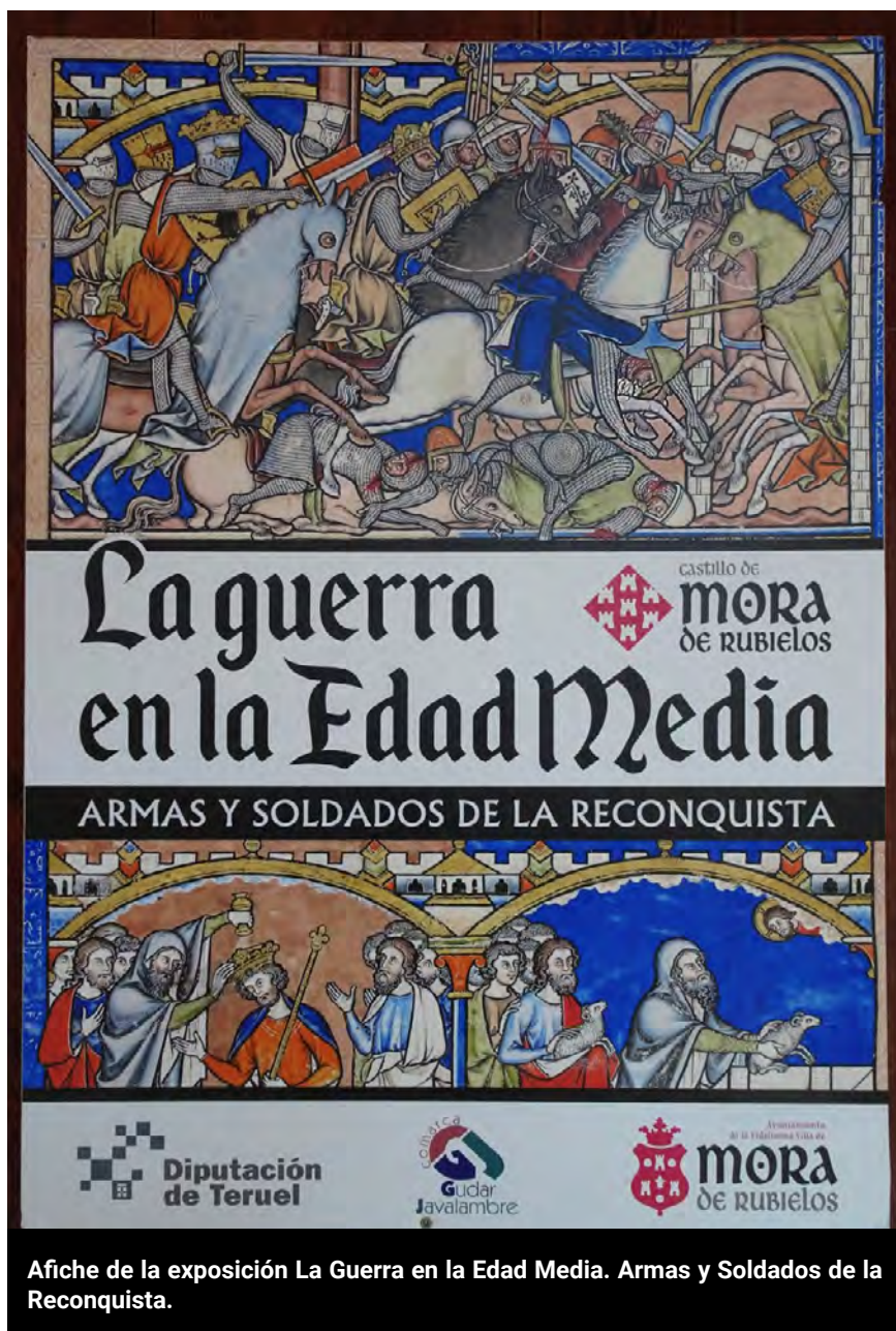
Afiche de la exposición La Guerra en la Edad Media. Armas y Soldados de la Reconquista.

“Si los modelos son adecuados y creativos, y está bien diseñado el programa didáctico y la difusión, la atracción turística estaría asegurada, además de servir de acicate a la investigación y divulgación de la historia de dichos castillos y su territorio...”