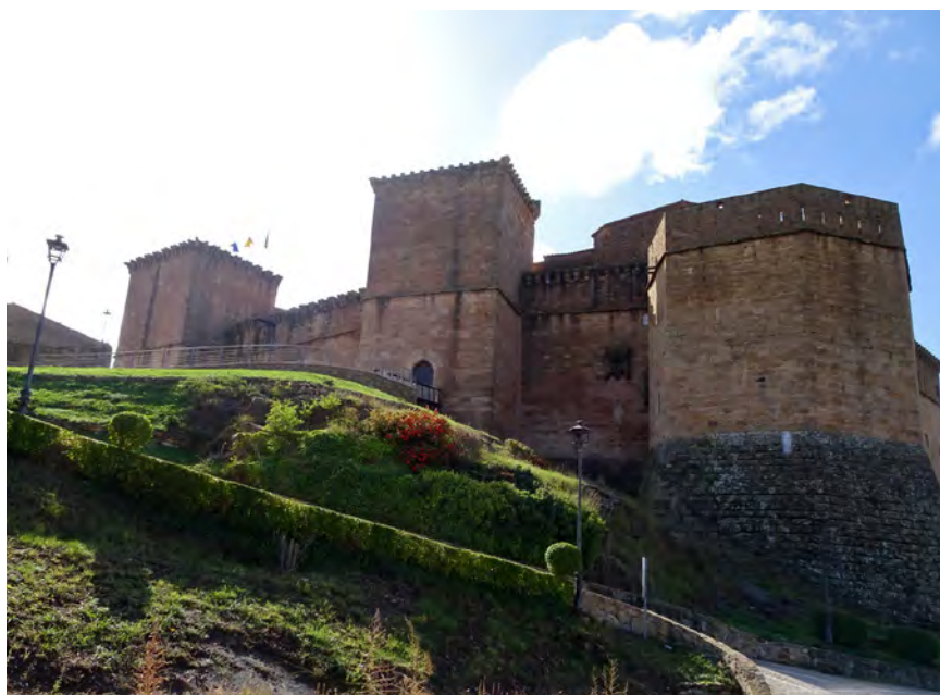
Castillo de Mora de Rubielos.

“Son necesarios pues recursos como los patrimoniales que propicien la fijación de población laboral, en un contexto demográfico descendente y muy envejecido, y que sean la alternativa de otras actividades económicas tradicionales, como la agricultura de cereal de invierno o la minería del carbón.”