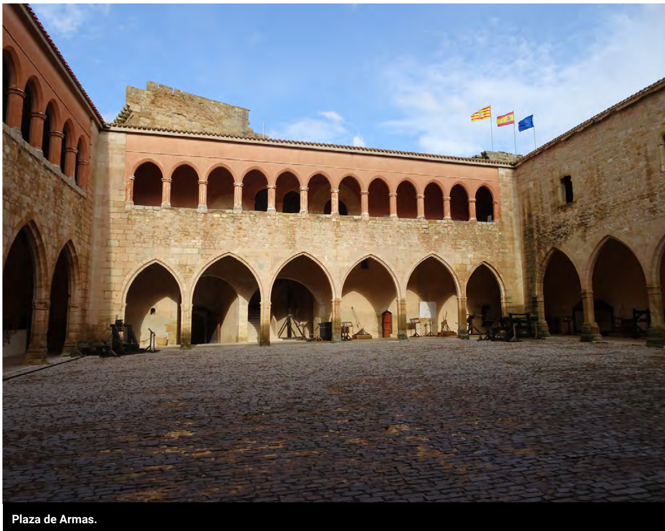
Plaza de Armas.