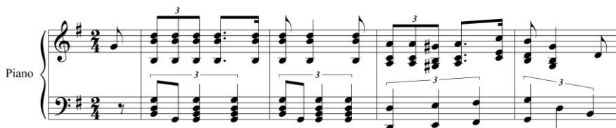
Imagen 1. Londón carapé (cuatro primeros compases), colección de Aristóbulo Domínguez, en: Federico Riera, Recuerdos musicales del Paraguay , cit., p. 41.