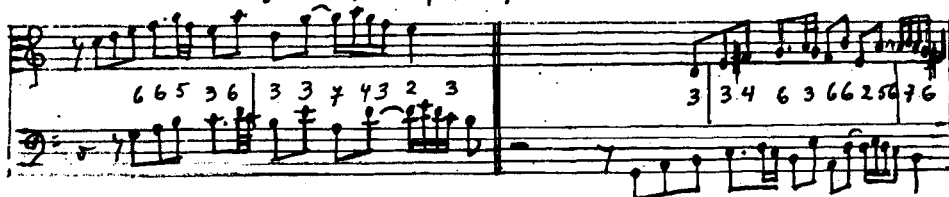
Fuga No. 1, I compás 7 y ss.

Voz superior S transportada una 4ª justa descendente. En consecuencia la voz inferior R se transporta una 5ª justa ascendente.