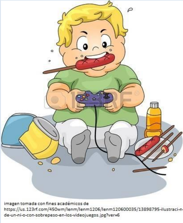
imagen tomada con fines académicos de https://us.123rf.com/450wm/lenm/lenm1206/lenm120600035/13898795-ilustraci-n-de-un-ni-o-con-sobrepeso-en-los-videojuegos.jpg?ver=6

En lo que se refiere al sedentarismo, la progresiva disminución de espacios recreativos y actividades al aire libre que fomenten la actividad física, ha llevado a que el niño pase más tiempo realizando actividades sedentarias tales como mirar televisión o jugar con los videojuegos. Datos del National Health Examination Survey han demostrado que el número de horas que un niño ve la televisión está íntimamente relacionado con el riesgo a desarrollar obesidad. La televisión suele anunciar