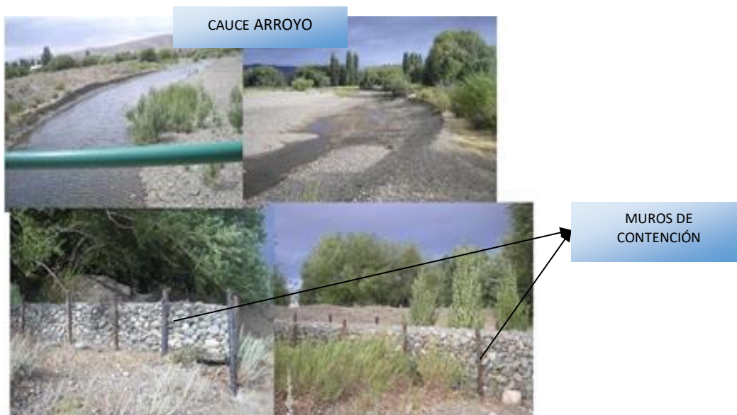
Figura 2: Arroyo Lepá, cuenca del río Tecka-Gualjaina, Chubut, Argentina. Fotografías tomadas en enero de 2014.

En el valle del arroyo Lepá se observa claramente la gran energía que trae el agua en momentos de crecida, su amplio lecho y los diferentes tamaños de rodados que en el mismo se encuentran dan cuenta de ello. A lo largo de su recorrido, principalmente a la altura del pueblo de Gualjaina, la presencia de defensas denotan la altura y fuerza que las aguas del arroyo poseen cuando presenta gran caudal (ver Figura 5). Si bien el área se encuentra en un período de sequía, en 1932 la crecida del arroyo llegó a cubrir prácticamente todo el poblado afectando en mayor parte el pastoreo de ovinos, principal actividad en esos años (ver Figura 2).