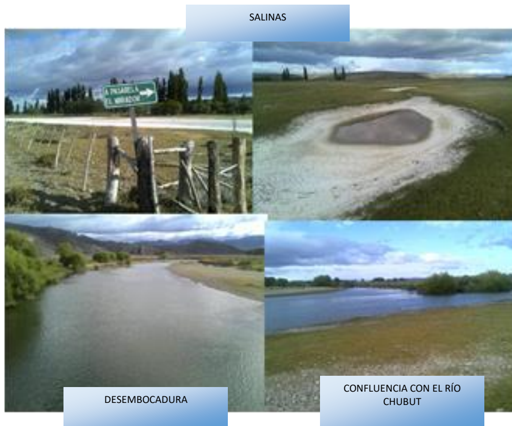
Figura 3: Salinas y desembocadura del río Gualjaina en el río Chubut, Provincia de Chubut, Argentina. Fotografías tomadas en enero de 2014.

Continuando hacia el Sur, se llega a la zona de confluencia del arroyo Pescado con la intersección del curso del río Tecka, el cual a partir de allí adquiere el nombre de río Gualjaina hasta su desembocadura. Las características de un ambiente más húmedo se mantienen a lo largo del curso del río diferenciándose cada vez más del resto de la cuenca.