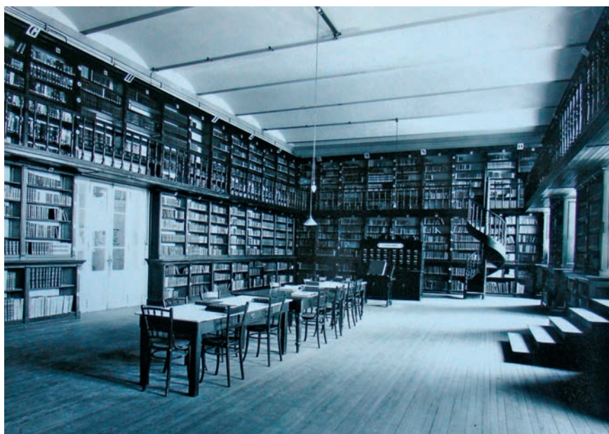
Ilustración 2. La actual sala Card. Mejía circa 1917.

En 1897 comenzaba la obra del edificio en el cual estamos hoy parados y para principios de 1899 se realizó el traslado de los 160 alumnos, bienes y libros del edificio de Regina al de Villa Devoto. 7 Para completar la imagen de esta etapa, consignamos el testimonio de la donación hecha por el Sr. Don Tomás de Anchorena, que construyó las dependencias de las clases de Teología Dogmática, Teología Moral, Filosofía y Derecho Canónico, “con sus accesorios de Biblioteca, muebles, útiles, galerías, revoques y pinturas.” Esta donación ascendía a la suma de $70.000 pesos, otros $5.000 pesos para libros de Filosofía y Teología. Esta es la que llamamos Biblioteca Antigua, con sus salas Cardenal Mejía, en recuerdo de uno de sus Bibliotecarios, profesor y además Bibliotecario de la Biblioteca Apostólica Vaticana; y la sala Cardenal Quarraccino en memoria del Arzobispo de Buenos Aires que la dotó en varias oportunidades.