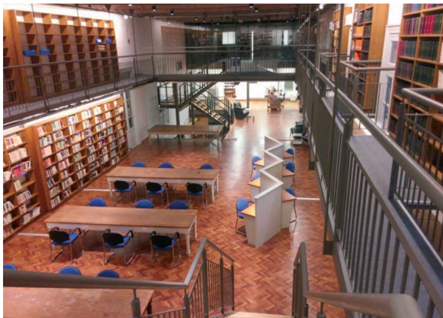
Ilustración 3. La Sala Roemmers de la Biblioteca de Teología

La vida de una Biblioteca es siempre la de una comunidad dinámica que intercambia dones, aptitudes, búsquedas, dedicación y tiempo. En el caso de una Biblioteca asociada a una Facultad de Teología y a la formación para la misión de la Iglesia en sus diversos estados de vida, sacerdotal, vida consagrada y laical, la dimensión humana es aún mayor porque como decía el recordado Papa Pablo VI, la Iglesia es y debe ser “maestra en humanidad”.