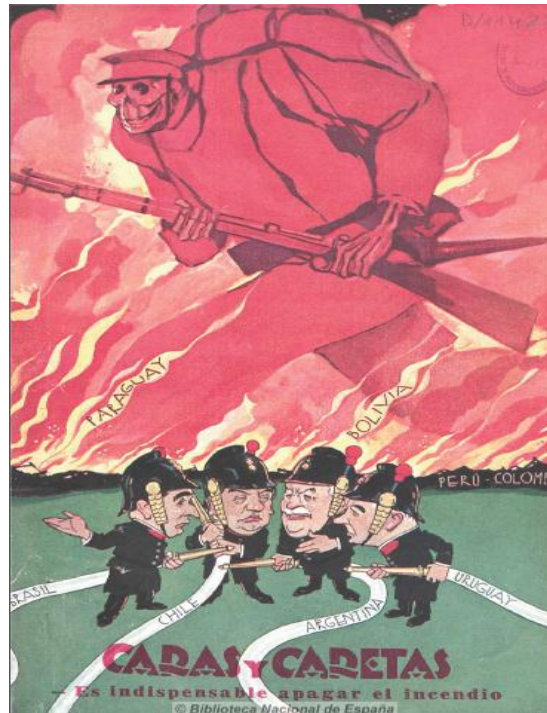
Caras y Caretas , N° 1.793, 11-02-1933

En consecuencia y entendiendo en el mismo sentido el momento, en enero de 1933, el canciller argentino dirigió una nota a sus colegas brasileño y chileno informando de las gestiones emprendidas, indicando éste último que también había enviado, por su cuenta, una propuesta a los beligerantes. 17