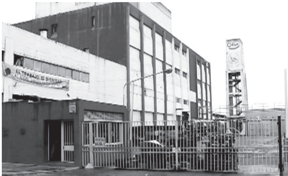
Planta Industrial de Cotar ubicada en calle Humberto Primo 1255 Rosario

Los avatares de la Segunda Guerra Mundial llevaron a la comercialización de la leche en polvo y durante la posguerra la producción industrial de leche abastecía de gran manera a la industria confitera. Las nuevas formas de consumo, vinculado con los modernos hábitos sociales -como las famosas lecherías de los años '50, y el cacao en polvo para la población infantil, entre otras-, aumentaron las ventas e hicieron desarrollar productivamente los tambos bonaerenses y su zona láctea como proveedores de la Capital Federal y de la provincia de Buenos Aires. De esta manera a la producción de nuestra zona tampera, le cupo el orgullo de ser la única proveedora de leche de la ciudad de Rosario y alrededores, uniendo la tarea tampera de cordobeses y santafesinos. Dos regiones lácteas argentinas se consolidaron definitivamente a partir de mediados del siglo XX: la provincia de Buenos Aires (centro- sur) y el sur de las provincias de Córdoba y de Santa Fe.