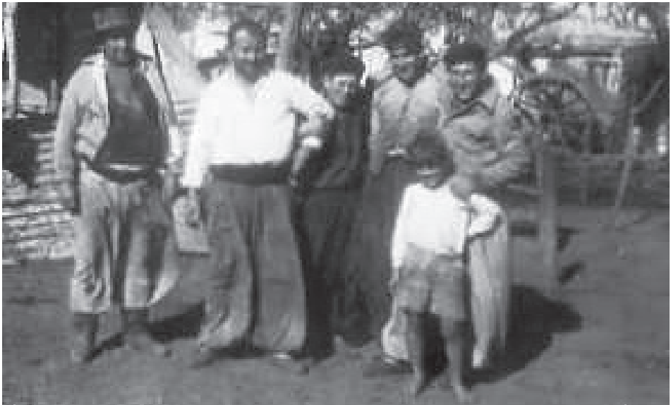
Tamberos de la localidad de Roldan en plena tarea

Así para la segunda y tercera década de este siglo, la principal actividad productiva de Roldán se refugiará en los tambos, teniendo en la agricultura de cereales su segundo rubro como base ganancial de los estancieros. Lo cierto es que el auge y prosperidad de la industria láctea, no deja de lado a la producción agrícola. La misma comenzará a ser levemente desplazada hacia los años '40, debido a las fluctuaciones internacionales de los precios y a desventajas propias de la tarea agrícola a nivel nacional.