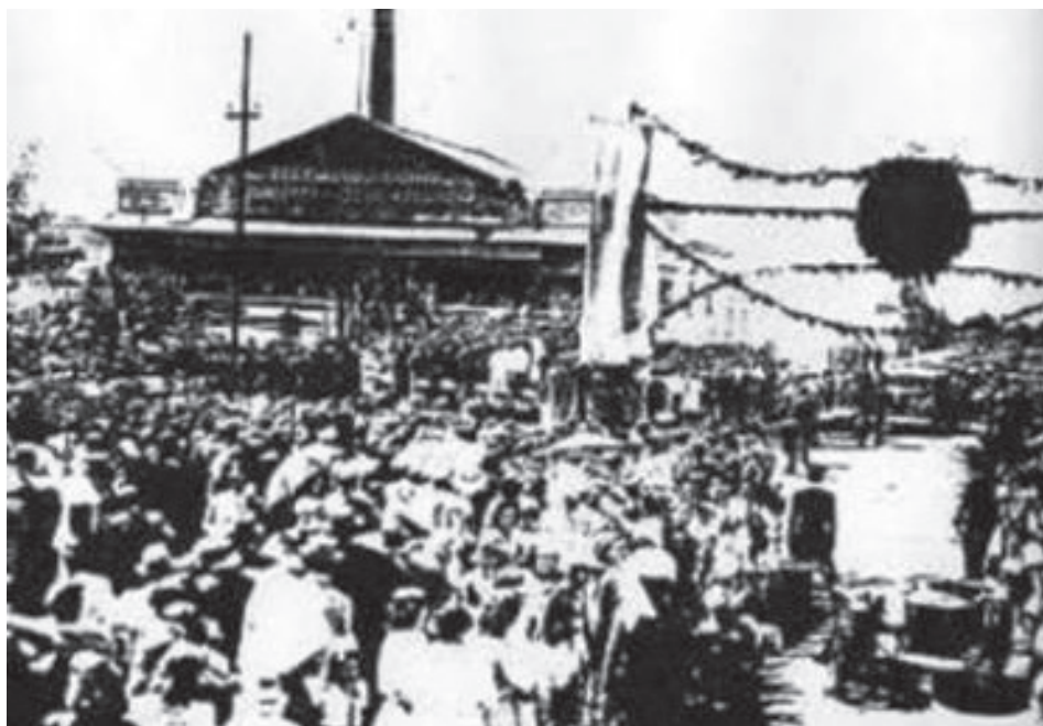
Imagen del público que asistió a la inauguración de la fábrica de Roldán

Se clausuraba así una etapa en los reclamos de derechos por parte del trabajador lácteo y comenzaba ahora la defensa de la modernización industrial. La cooperativa ya poseía una fábrica en la localidad cordobesa de Monte Flores, y en el año 1942 adquiere el establecimiento en Roldán, situado en la zona norte del pueblo, luego ampliado y acondicionado con la incorporación de modernos equipos técnicos. El mismo comienza a funcionar un año después, recibiendo el extraordinario caudal de 2.000 litros de leche diarios. 51