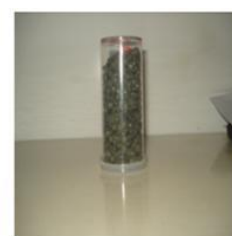
Lentejas de PEAD reciclado Materia prima otro proceso 8

Según los diferentes usos que se le puede otorgar a dichas moliendas, las que incorporadas en algunos materiales para la construcción constituyen partes de una vivienda social que responde ambientalmente, lo que se observa en el gráfico siguiente.