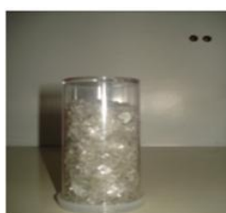
Molienda de un envase de PVC.