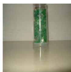
Molienda de un envase de PET.