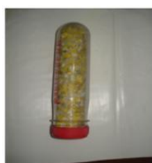
Molienda de un envase de PEAD.

Con respecto al estudio de los plásticos molidos obtenidos de empresas recicladoras de este residuo podemos referencias las siguientes fotos y descripciones: