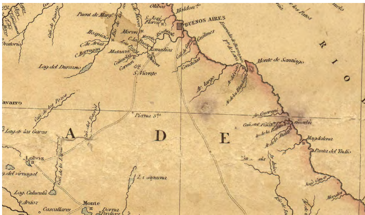
Figura 4. Detalle de la Carta de la provincia de Buenos Aires de 1824.