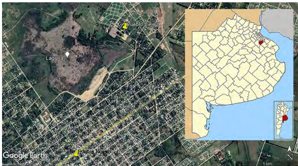
Figure 1. Location of the Old and New Towns of San Vicente, Buenos Aires province, Argentina.

las localidades mencionadas y también identificamos quiénes fueron los milicianos y militares pobladores de San Vicente a principios del s. XIX y su inserción en los distintos grupos familiares censados en 1815 ya que, aun cuando fueron por entonces identificados, han sido poco visibilizados tanto por la historiografía local, como por la historia oral de la comunidad que aún lo habita. Así consideramos importante revisar no solo aspectos importantes de la genealogía de los Pessoa y los Chavarría para los momentos fundantes de este poblado sino, también, la historia de la conformación, evolución y posibles escenarios de este pueblo en donde los vecinos vivieron hasta mediados del s. XIX.