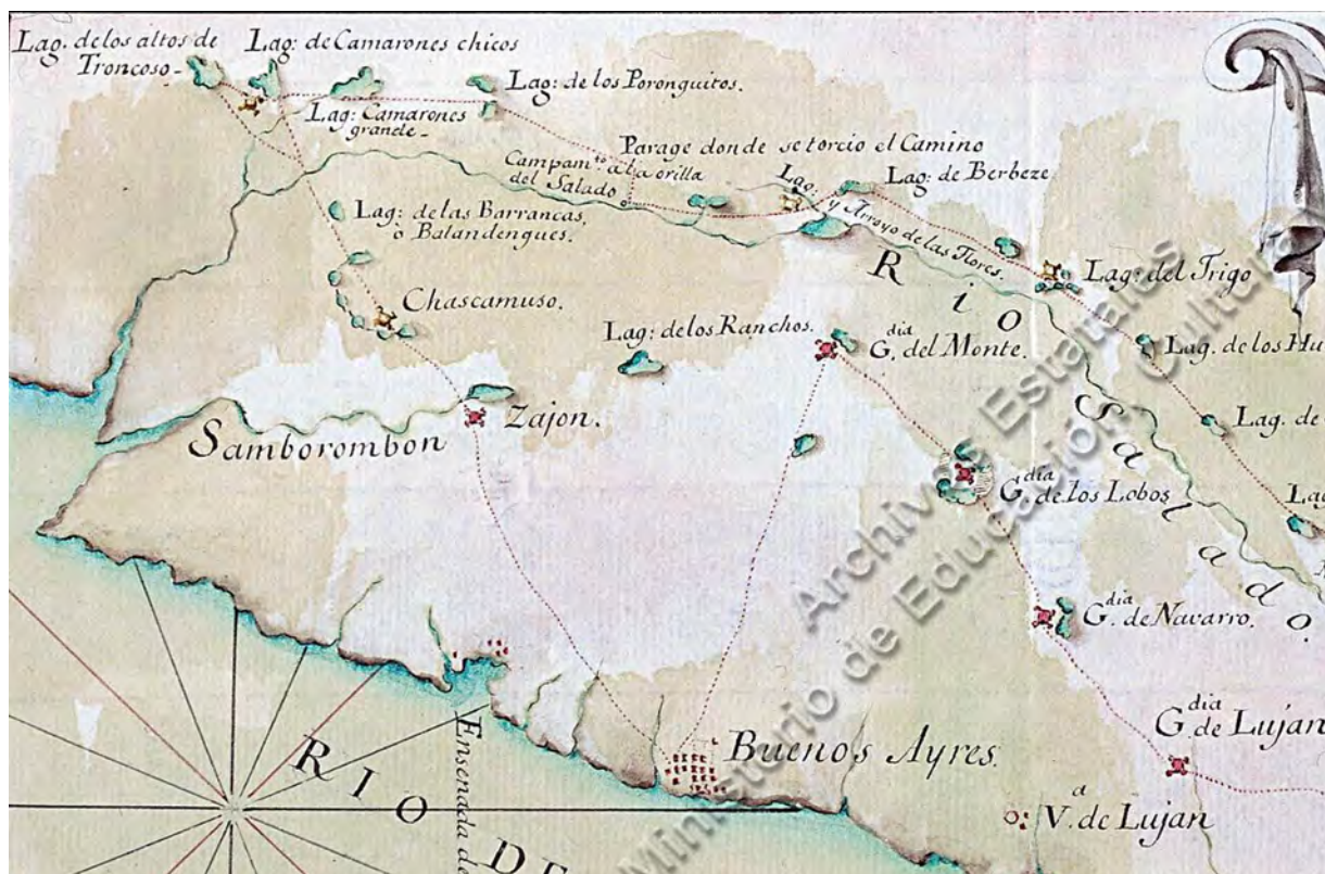
Figura 3. Detalle del mapa de la frontera sur de Buenos Aires de 1779.