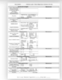
[Formulario digital], a la derecha se observa el hipervínculo a la descarga de su versión imprimible]

¡Bienvenido/a a la ficha de registro digital! Esta herramienta corresponde a la versión digital de la ficha institucional imprimible y está destinada a la carga de datos de nuevos usuarios/as. Una vez completados los campos solicitados, solo es necesario presionar el botón "Registrar usuario" para que la información se registre automáticamente en la base de datos institucional. ¡Click aquí para descargar el imprimible!