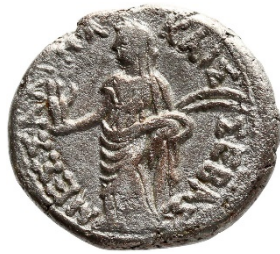
1. Revers d'un tétradrachme émis à Alexandrie en 41-42 représentant Messaline.

silhouettes dans sa main droite, généralement identifiées comme étant ses enfants Britannicus et Octavie 38 . Une autre monnaie, cette fois-ci émise à Gortyne, entre les années 41 et 43, l'identifie sous le nom de Valeria Messalina 39 ( illustration 2 ). Certaines cités de la partie orientale de l'Empire n'avaient donc pas tardé à honorer l'épouse de Claude. Si quelques portraits de Valeria Messalina agrémentaient dès ce moment la parure urbaine de Rome, nous pouvons penser que les magistrats en charge relayaient donc le discours du Prince. Autrement dit, l'on pouvait lire son nomen accompagné de son cognomen , ou le seul cognomen , suivi de la mention de son statut d'épouse 40 .