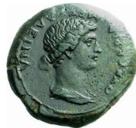
2. Revers d'une monnaie émise à Gortyne à l'effigie de Messaline.