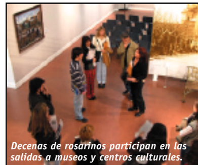
Decenas de rosarinos participan en las salidas a museos y centros culturales.