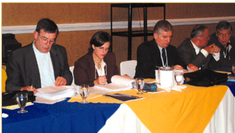
Momento de trabajo durante el desarrollo de las ponencias.

Por la tarde, las universidades presentaron sus ponencias y mantuvieron un debate sobre los temas identificados como más relevantes en el mundo universitario del continente. El primer día del encuentro fue cerrado con la exposición que Mons. Zecca realizó en torno a la problemática de la liberalización del comercio de servicios educativos en el marco de la OMC, y sus consecuencias tanto para la calidad como para la equidad en los sistemas nacionales de educación superior de los países en desarrollo. Se preguntó entonces a la asamblea, ¿cómo pueden las universidades religiosas aportar a la intensificación de nuestras identidades, evitando la virtual invasión cultural que estos desarrollos traerán aparejados? A partir de las palabras de nuestro Rector, se generó una animada