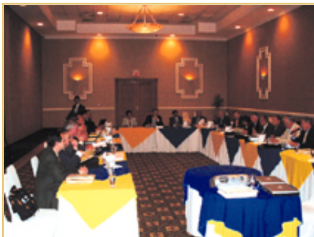
Desarrollo de las ponencias en el salón principal.