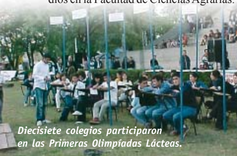
Diecisiete colegios participaron en las Primeras Olimpiadas Lácteas.

Asimismo organizó las Primeras Olimpiadas Lácteas, junto con el Camión Tecnológico INTA – Castelar e Infortambo Exposiciones, con el auspicio de los Ministerios de Educación de las Provincias de Córdoba y Santa Fe. Estas Olimpiadas estuvieron dirigidas a los alumnos del último año del nivel medio, con la participación de 17 colegios y la presencia de 300 alumnos, que compitieron en rondas de preguntas de opción múltiple. Dentro de los premios, se incluyeron becas de estudios en la Facultad de Ciencias Agrarias.