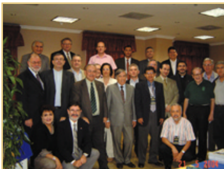
Un grupo de asistentes a la 2° Reunión Regional de Universidades y Religiones.

Sobre el final del encuentro y a partir del acuerdo alcanzado respecto de los principales y más urgentes desafíos identificados, se debatió la necesidad de generar un medio estable de comunicación e intercambio. Finalmente, esta voluntad se materializó en el significativo compromiso que los presentes asumieron al crear la Red Universitaria Interreligiosa de América Latina y el Caribe (REUNIR). Según quedó establecido en