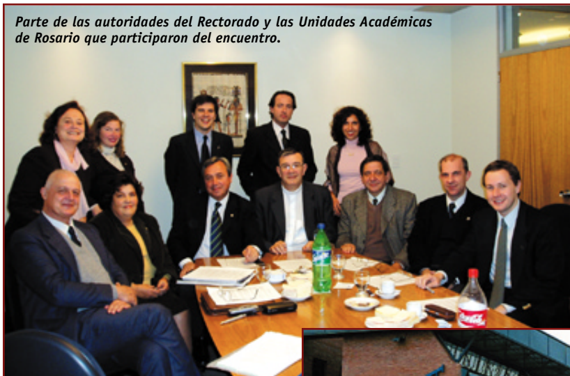
Parte de las autoridades del Rectorado y las Unidades Académicas de Rosario que participaron del encuentro.