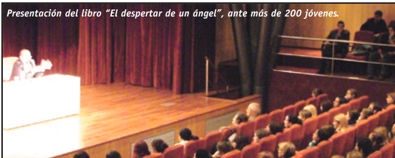
Presentación del libro "El despertar de un ángel", ante más de 200 jóvenes.

Abierto a toda la comunidad rosarina, el Centro Cultural se ha establecido con fuerza como un espacio cultural, tanto para profundizar, reconocer y aprender distintas artes y técnicas, como para convertirse en un ámbito de enriquecimiento personal y humano. Sus objetivos planteados a nivel país, la iniciativa y el afán de crecer son los principales motores de este Centro Cultural que en Rosario suma apoyos y colaboraciones día a día.