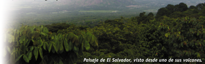
Paisaje de El Salvador, visto desde uno de sus volcanes.

Este anuncio coincide con el viaje del P. Bochatey a Roma, con motivo del Congreso de la Federación Internacional de Centros e Institutos de Bioética de Inspiración Personalista (FI-BIP), creado el año pasado y del cual el Instituto de Bioética de la UCA es miembro fundador. ●