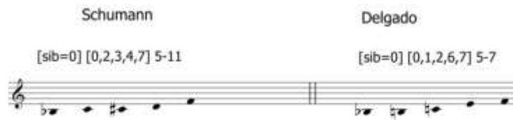
Fig. 19. Pentacordios comparados

Un paso más en el análisis, será integrar los dos tricordios de la parte de vibráfono en un solo conjunto de alturas, dando como resultado el pentacordio [0,1,2,6,7] y establecer una comparación con el pentacordio correspondiente al ripieno de Schumann.