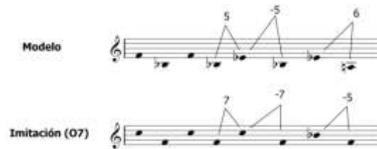
Fig. 31. Imitación no estricta del violín (07)

completar la serie 55 . La imitación del violín, expresa el intervalo estructural de la melodía (clase interválica 5,7). Se encuentran algunas alteraciones en torno al orden de sucesión de los valores que componen la imitación 56 .