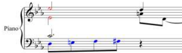
Fig. 32. Compás 21 de Schumann