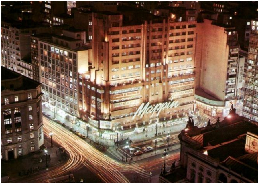
Figura 5 - loja de departamentos Mappin situada em frente à fachada do Teatro Municipal de São Paulo-SP, cuja lateral e parte do telhado podem ser vistos no canto inferior direito da foto.

Na primeira advertência Cozzella determina um prazo de validade para sua obra, evidenciando a perecibilidade da obra de arte, em contraposição à ideia de posteridade, da qual era avesso. Na segunda advertência, indica que se conheça antes os preços do Mappin (uma loja de departamentos que, na época, situava-se em frente ao Teatro Municipal - Figura 5), colocando, assim, a obra de arte no mesmo patamar do consumo, tirando-lhe toda a aura de superioridade e atribuindo-lhe unicamente o valor de mercadoria, como qualquer outra.