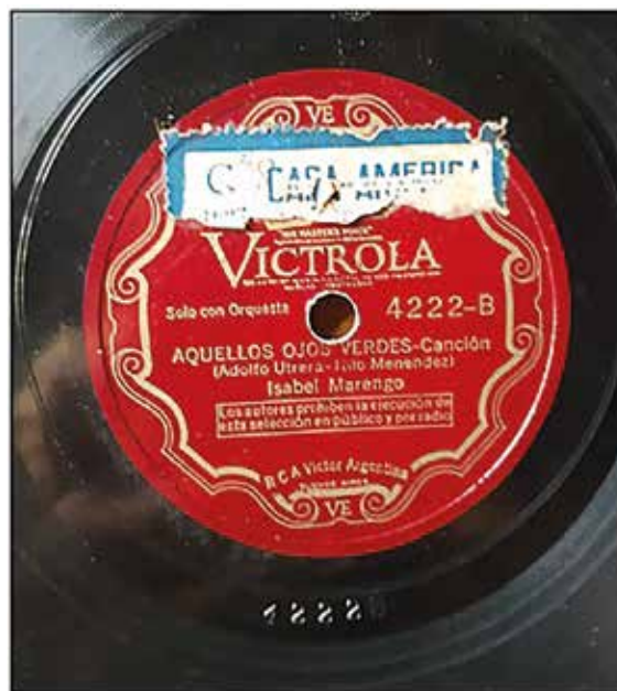
Figura 6: disco n.º4222 de sello Victor, lado B. 37

Con el tiempo, durante la entrevista, la Sra. Zaffino recordó: «Marengo llevó al conservatorio un 'disquito'. Cantó... Aquellos ojos verdes ... una belleza de canción» [Figura 6]. 36