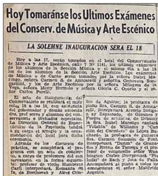
Figura 5: diario El Argentino , 12 de mayo de 1949, 8.

rentes carreras, quiénes conformarían las mesas evaluativas, como así también se difundió el programa previsto para el acto inaugural y los artistas participantes.