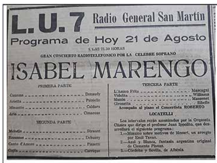
Figura 2: programa publicado en La Nueva Provincia , 21 de agosto de 1935, 12.