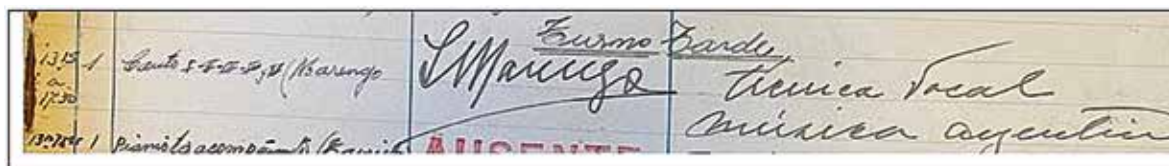
Figura 7: libro de firmas de docentes, años 1952-1953, preservado en la Biblioteca del Conservatorio Gilardo Gilardi, en la ciudad de La Plata.