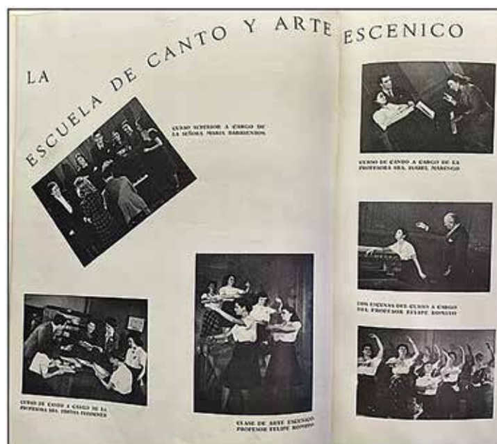
Figura 3: revista Lyra n.º 2 (1943).