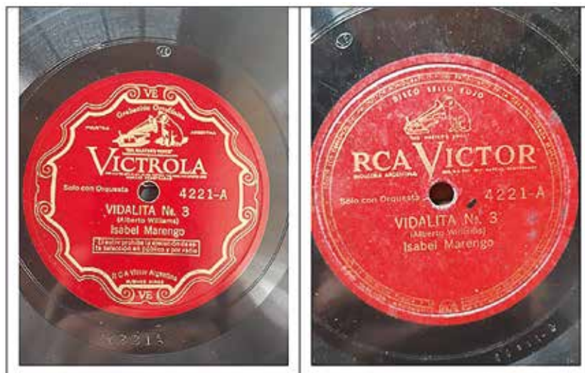
Figura 1: discos 4221-A de RCA Victor, original y reimpresión. 16

colaboró con esta investigación permitiéndome acceder a una copia del disco 4221 grabado por la soprano. Así, he podido confirmar que corresponde al llamado «Sello Rojo» y que la Vidalita , presente en el lado A, se acompaña, del otro lado, con Serrana , de Felipe Boero. Al mismo tiempo, se corrobora que el acompañamiento fue de orquesta. En entrevista con el mencionado pude saber que contaba con más de un ejemplar de esa grabación por la misma intérprete. De esta manera, para sorpresa de ambos, observamos que las copias reflejan una diferencia que permite deducir una reedición —o al menos, una reimpresión— del disco 4221 [Figura 1]. Mi conjetura sostiene que, en su momento, fue necesaria la reimpresión de discos, posiblemente por causa de la demanda. Ponce señala que, como se puede ver en las fotografías, los discos tienen grabados —además del número que los identifica en el centro rojo—, otro número diferente, que mostraría que el segundo fue reimpreso desde la matriz.