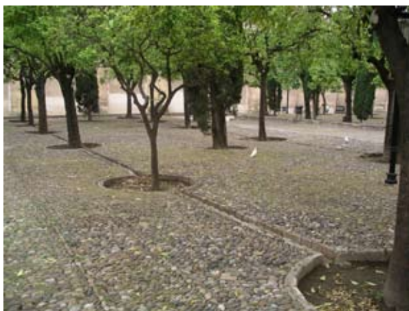
Figura 3. Riego por alcorques. Patio de los Naranjos. Mezquita de Córdoba.

Según otros autores (Cherif Jah y López Gómez, 1994), también hay que regar las plantas cuyas raíces quedan al descubierto. En cambio, a las plantas débiles no hay que darle mucho riego. El agua estancada por un tiempo se estima que es perjudicial para los árboles que no son frutales.