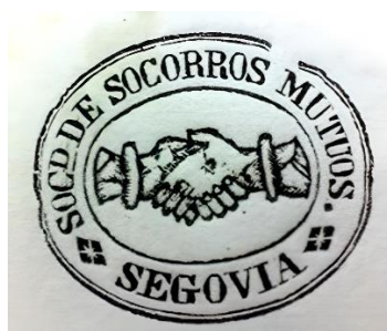
Figura 8. Sello de la Sociedad de Socorros Mutuos La Benéfica , AMS, exp. 1.076-4.

Ante este continuo malestar, las reiteradas peticiones a los organismos competentes y la no mejora de su situación, poco a poco fueron nutriendo a este elevado grupo de lo que hasta entonces carecían: la conciencia de clase. Esta fue la base del peso, de la importancia y del poder que adquirieron. A finales del siglo XIX empezaron a organizarse en pequeños grupos de obreros denominados sociedades de socorros mutuos (germen de las sociedades de resistencia) mediante las cuales poder hacer frente a los continuos problemas que les acuciaban. 56 La primera que apareció fue la Sociedad de Socorros Mutuos de la Sociedad de Segovia en 1879; tres años más tarde nació su homónima en el pueblo segoviano de Santa María la Real de Nieva. En 1890 surgieron dos nuevas: La Fuencisla y la Benéfica con 376 y 498 afiliados respectivamente (figura 8); así hasta contar con doce entidades a la altura de 1905 (figura 9).