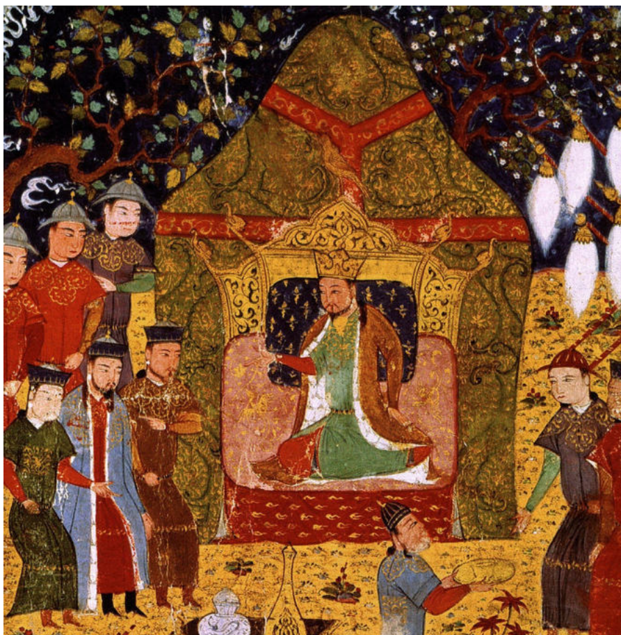
La proclamación de Gengis Khan.

aproximadamente, todos los pueblos mongoles se habían organizado y estaban preparados para lanzarse a la conquista de nuevos orbes. Previo a las conquistas, Gengis Khan junto a sus consejeros, restablecieron el orden dentro de territorio asesinando a todos aquellos que se opusieran al régimen y creando un código de leyes escritas que se llamó el Gran Yassa con el objetivo de mantener el orden entre sus ciudadanos y en caso de incumplimiento se castigaba con la muerte; además buscó mejorar las relaciones con las tribus poderosas de la confederación a través del matrimonio.