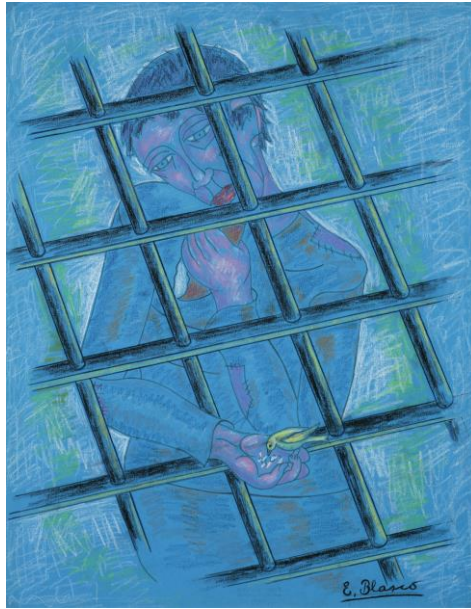
Fig. 1 Blasco Ferrer, “El preso y la libertad” (h. 1947)