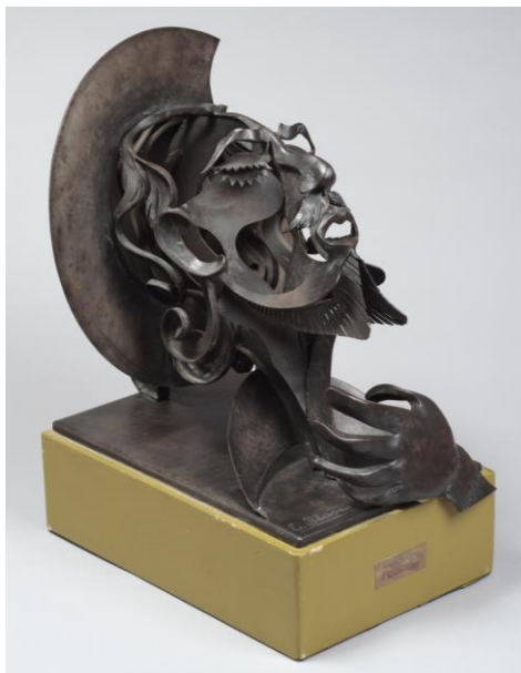
Fig. 4 Blasco Ferrer, “El último suspiro de Don Quijote” (h.1950)

La obra de García Tella se expone por primera vez en España en el año 2018, tres óleos se mostraron en París pese a todo. Artistas extranjeros, 1944-1968 celebrada en el Museo Nacional Centro de Arte Reina Sofía. 54 Al año siguiente lo hacía con la pintura “La muerte de García Lorca” (1953) en 1939. Exilio republicano español , organizada por el Ministerio de Justicia. A escasos metros, en la misma sala, se encontraba la escultura “El último suspiro de Don Quijote” de Eleuterio Blasco Ferrer. Uno de los aspectos a tener en cuenta es que, el artista madrileño perdió la oportunidad de retomar el contacto con España en la última etapa de su vida, teniendo en cuenta que desde los años sesenta el régimen había tolerado las visitas de los exiliados al interior del país, momento en el que muchos viajaron y fueron progresivamente regresando, tal fue el caso de Eugenio Granell, Ramón Gaya, Vela Zanetti, Luis Seoane e, incluso, el propio Blasco Ferrer. Sin embargo, en el caso de García Tella no fue así, el dramaturgo, pintor y crítico de arte, no volvería a pisar suelo español, por tanto, no se produciría el ansiado retorno.