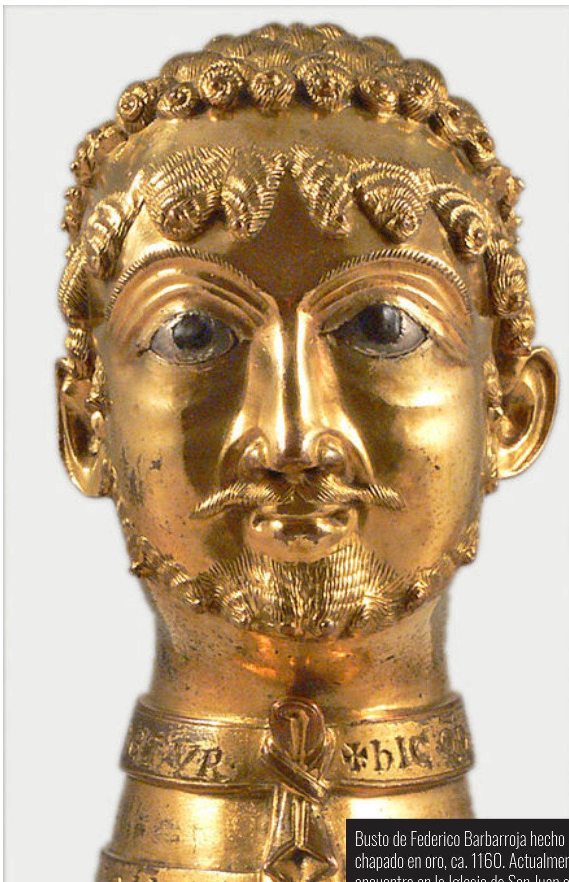
Busto de Federico Barbaroja hecho de bronce y chapado en oro, ca. 1160. Actualmente se encuentra en la Iglesia de San Juan, en Renania del Norte-Westfalia.