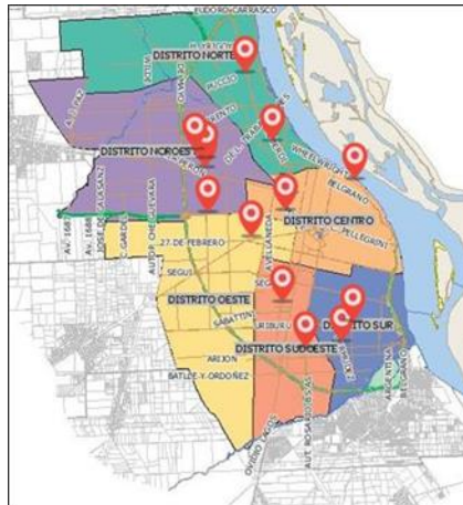
Fig. 1. Centros Verdes para las RAAEIT

como centro de origen o punto de referencia para la gestión de logística.