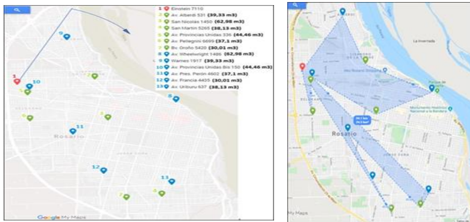
Fig. 4 Bosquejo del método de barrido para la ruta de recolección de RAEEIT

Paso 2. A partir del depósito se dibuja una línea recta en cualquier dirección. Esta línea hará las veces de una “aguja giratoria” que irá tocando todas las paradas. Se gira la línea recta alrededor del depósito hasta tocar una parada. Si la demanda en esta parada no excede la capacidad disponible del vehículo, se incluye en la ruta, continuando con el giro de la recta hasta tocar la siguiente parada. Otra vez, si la demanda en la nueva parada no rebasa la capacidad disponible del vehículo, se incluye en la ruta y se prosigue con el giro de la recta. Continuando así, se completan las paradas para el primer vehículo en el momento en que la parada que se examina tiene una demanda que rebasa la capacidad disponible del vehículo. Esta parada es la que inicia el próximo ciclo para determinar ruta, usando el siguiente vehículo de mayor capacidad. Este procedimiento se muestra en la Figura 4.