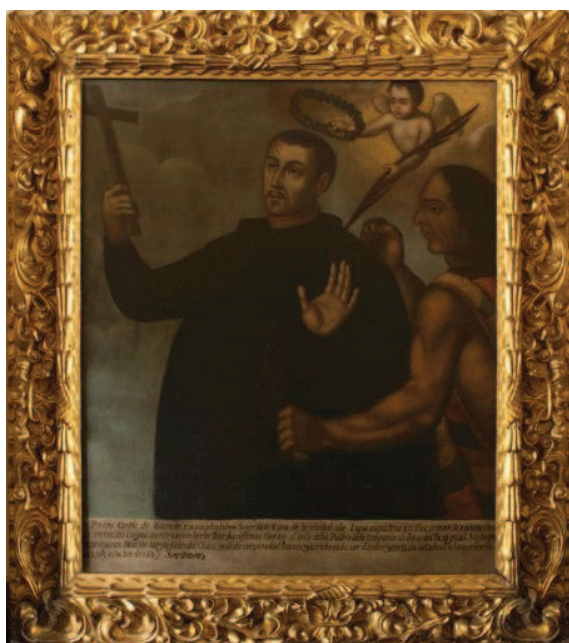
Ilustración 3: Anónimo (siglo XVII). Don Pedro Ortiz de Zárate . Óleo sobre tela, 117 x 88 cm. Colección Iglesia Museo de Santa Clara. Museo de Arte Colonial. Bogotá. (Reproducción disponible en: http://www.museocolonial.gov.co/colecciones/piezas-del-mes/Paginas/Don-Pedro-Ortiz-de-Z%C3%A1rate.aspx ).

Observemos ahora el caso de la pintura anónima del siglo XVII en la que se representa el instante en que Ortiz de Zárate con la cruz en alto es atravesado por la daga de un enemigo, y coronado como mártir de la cristiandad por un ángel (Ilustración 3).