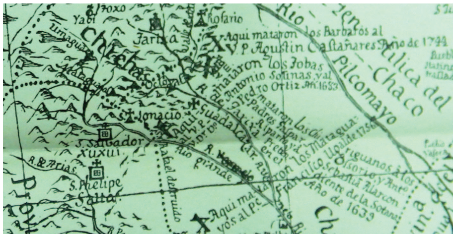
Ilustración 4: Detalle de Mapa en el que se representan los martirios de Ortiz de Zárate y Solinas. (Furlong, 1936, Mapa N° XXXII, “Parte de la America Meridional en que traba el zelo de los Religiosos de la Compañía de IHS de la Provincia dicha del Paraguai”).

El proceso de construcción de la historia de la Orden y de reconocimiento de sus miembros puede observarse también en la cartografía de la Compañía. Así, por ejemplo, en algunos de sus mapas aparecen consignados los sitios en los que fueron martirizados los dos misioneros que encabezaron la entrada al Chaco en el año 1683, “el venerable” Ortiz de Zárate y el Padre Solinas (Ilustración 4). De este modo, estos dos personajes son reconocidos en la historiografía como mártires de la frontera indómita del Chaco. Estas representaciones cartográficas funcionan como lugares de memoria, puntos de recuerdo o hitos de las representaciones, de la reapropiación y construcción del pasado (López et al., 2017). En un sentido equivalente, los cuerpos ultrajados convertidos en reliquias operan como una cosificación del pasado, en tanto objetos tangibles de una narrativa sobre el pasado que triunfó sobre otras.