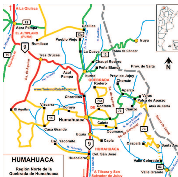
Ilustración 1: Mapa del sector norte de la Quebrada de Humahuaca, Jujuy. (Disponibile en: http://www.turismoruta40.com.ar/humahuaca.html ).

A lo largo del siglo XVII la localidad de Uquía (Quebrada de Humahuaca, Jujuy) funcionó como punto de concentración y partida de las misiones circulares que los miembros de la Compañía de Jesús desarrollaron hacia el Chaco Salteño (Ilustración 1). Los itinerarios espaciales configurados en esas misiones, así como la cultura material de origen español y cristiana introducida por los jesuitas en la región han sido reconstruidos en los trabajos previos (López, 2009, 2010; Lanza y López 2019) a partir del relevamiento y análisis de documentación jesuítica edita e inédita.