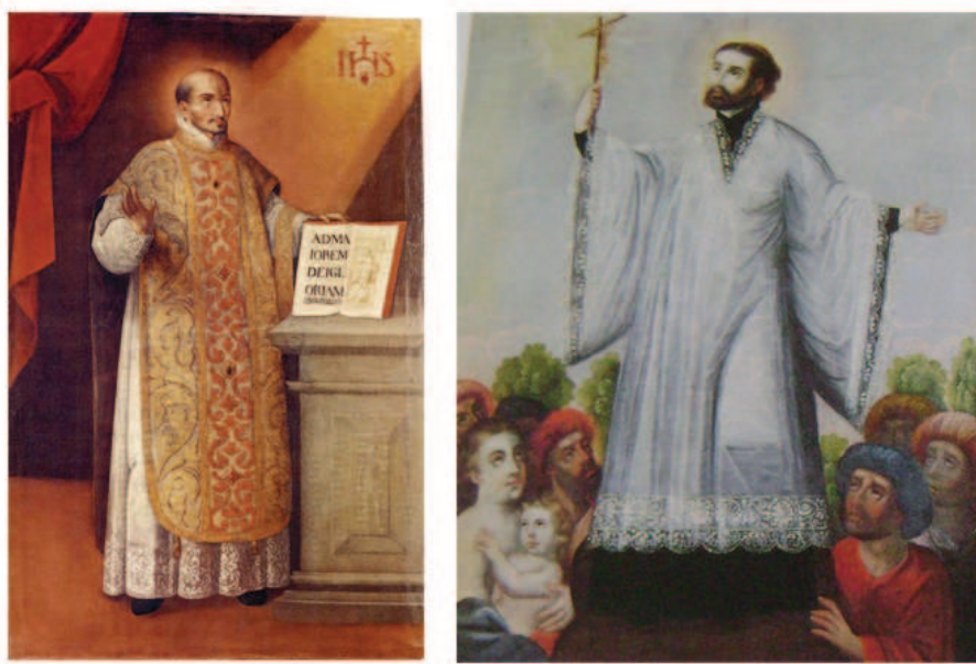
Ilustración 5: Representaciones pictóricas de santos jesuitas en el retablo de la Iglesia de Uquía. A la izquierda: Matheo Pizarro (fines del siglo XVII). San Ignacio de Loyola . Óleo sobre arpillera, 111,5 x 73 cm. (Reproducción disponible en: ANBA, 1991, p. 369). A la derecha: Matheo Pizarro (fines del siglo XVII). San Francisco Javier predicando a los orientales . Óleo sobre tabla, 104 x 85 cm. (Reproducción disponible en: ANBA, 1991, p. 370).

a los orientales con un crucifijo 15 (Ilustración 5). En el marco de este trabajo, esta última imagen adquiere especial valor ya que nos permite advertir que esta “fórmula iconográfica” (que no es privativa del santo jesuita) dialoga y se complementa con el “patrón narrativo” que se reitera en las distintas crónicas jesuíticas y que podríamos denominar como “cruces para evangelizar o predicar”.