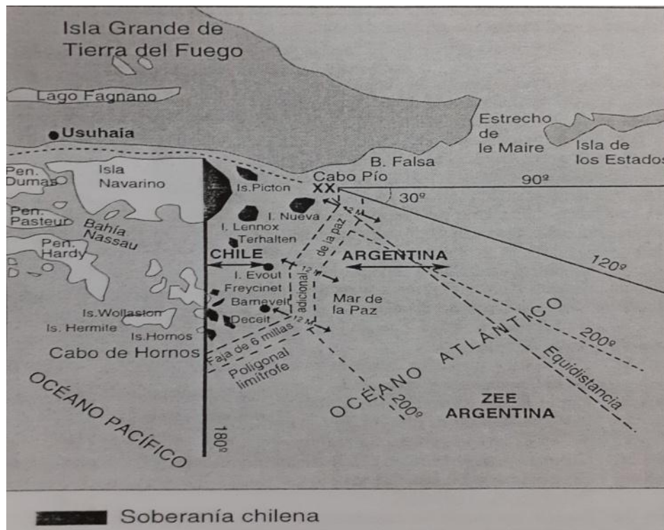
Imagen I-1. Propuesta Papal 1980. 48

A continuación, veremos una graficación de la Propuesta producto de las negociaciones: