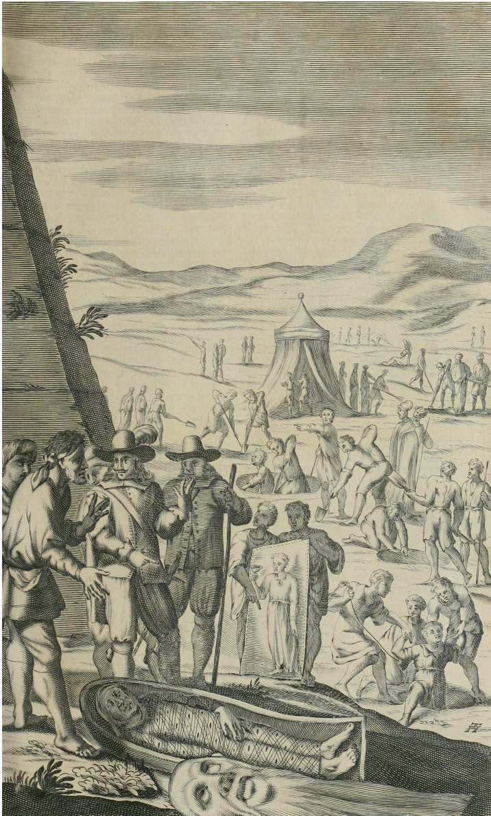
Fig. 1. Trabajos de Pietro della Valle en Saqqara (Della Valle 1674: lám. entre pp. 198 y 199).