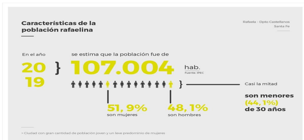
Imagen 2 Características de la población rafaquina