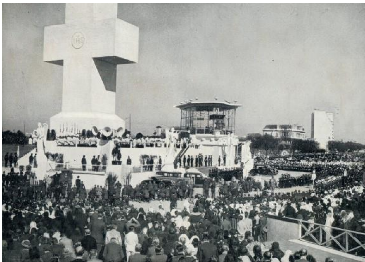
Altar Mayor, durante el oficio religioso dedicado al Ejército Argentino.

Por fin, el día 10 de octubre de 1934 tuvo lugar la apertura del XXXII Congreso Eucarístico Internacional, en el Parque Tres de Febrero de la ciudad de Buenos Aires. El acto se desarrolló en una plataforma que circundaba a El monumento de los españoles , al que ocultaba una cruz de 35 metros de altura que se transformaría después en el emblema del Congreso. A su turno, se leyó la Bula papal por la que el cardenal Eugenio Pacelli fue investido por su santidad Pío XI del cargo de delegado. Una Hora Santa sacerdotal completaba ese primer día de fe.