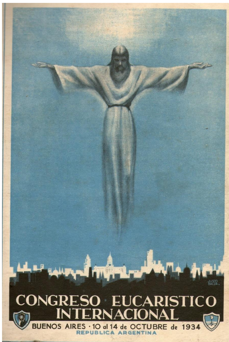
Afiche del Congreso Eucarístico Internacional que aparecía en la contratapa de la revista Para Ti edición dedicada al mencionado evento.