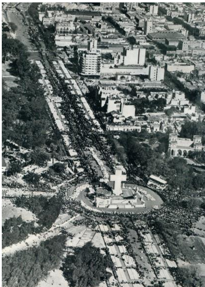
Aspecto de las calles del barrio de Palermo durante los distintos actos del Congreso el gran Monumento al iniciarse los diferentes actos.

De esta forma, con la mirada dirigida hacia el futuro, la repercusión del Congreso iba a perpetuarse más allá de aquellas jornadas, fortaleciendo las miradas e ideas acordes al espíritu de orden nacionalista, cuya cristalización llegaría hacia fines de la década. En consonancia, el Consejo Directivo del XXXII Congreso Eucarístico Internacional propuso que la Cruz levantada para tal efecto en los bosques parlemitanos de la Capital Federal se reproduzca en el espacio urbano de la zona y se emplace una capilla a fin de que, cada 12 de octubre, allí tuviera lugar una celebración eucarística.