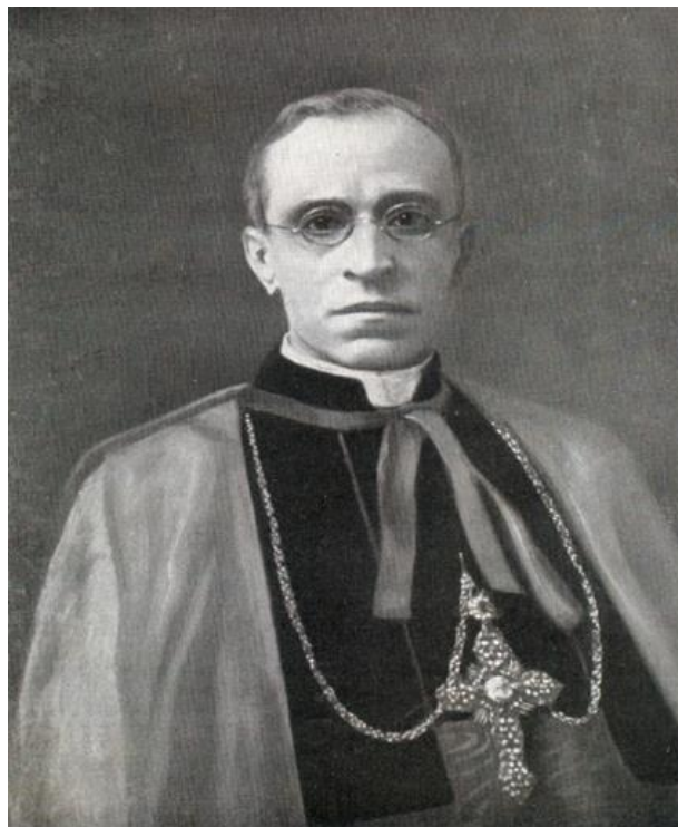
El Cardenal Monseñor Eugenio Pacelli, Secretario de Estado del Vaticano, quien invistió en el XXXII Congreso Eucarístico Internacional la representación de su santidad Pío XI.

Así, durante una semana se concentraría en Buenos Aires el interés de la opinión católica nacional e internacional, la cual contó con el representante del sumo pontífice, el Cardenal Eugenio Pacelli, futuro papa Pío XII.