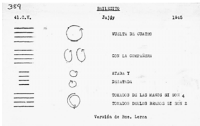
Fig. 2. Ficha 389, Bailecito. FDCV IIM. Esquema de la danza y estructura de los versos y las coplas.

Algunas fichas fueron escritas por Vega y otras por sus colaboradoras y discípulas; por esa razón se distinguen distintas caligrafías y se infiere que algunas fueron confeccionadas en el contexto del trabajo de campo y otras en gabinete 6 .